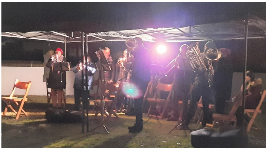
Bild: Der Posaunenchor spielt im Gottesdienst am Heiligen Abend in Schwörshcim.

Genau 100 Jahre nach dem ersten Auftritt des Posaunenchores an Weihnachten 1921, begleitete der Posaunenchor an Heilig Abend 2021 den Gottesdienst in Schwörshcim unter anderem mit dem Lied „Stille Nacht, Heilige Nacht“ als erstem Lied, das 1921 öffentlich gespielt wurde.