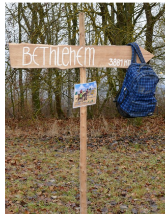
Bild oben: Aktive Krippe; Bild rechts unten: „Bethlehem: 3881 km“ – ganz so weit war der Stationenweg dann doch nicht.

An jeder Station gab es eine Geschichte, Gebete und ein Lied zum Anhören, oder auch ganz praktisch was zu tun. Trotz des anfänglich schlechten Wetters wurde der Weg viel genutzt. Danke für die viele positive Resonanz und großen Dank an alle die mit-überlegt, mit-gebastelt, mit-dekoriert und mit-unterstützt haben!